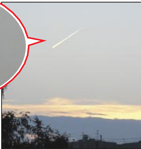
Воскресный вечер, 10 августа. Никто пока не знает, что же летало над столицей.

Фото и видеозапись «НЛО» я тут же выложил на сайт «Комсомолки» (kp.ru). И предложил нашим читателям попробовать разобраться. Многие предположили, что на снимках виден обычный самолет. Например, некто под ником pantherman написал так: «Выглядит, как след от самолета, освещенного лучами заходящего солнца. На увеличенном